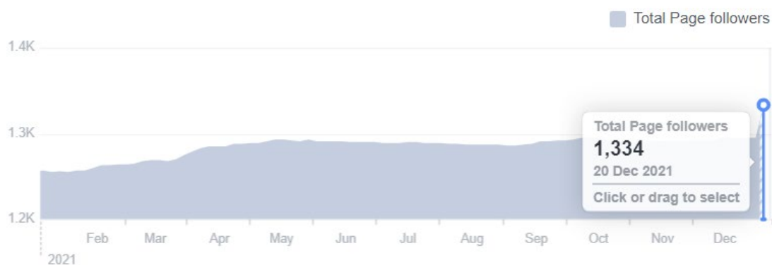
Слика 2. Укупан број свиђања странице ИЕН на друштвеној мрежи Facebook